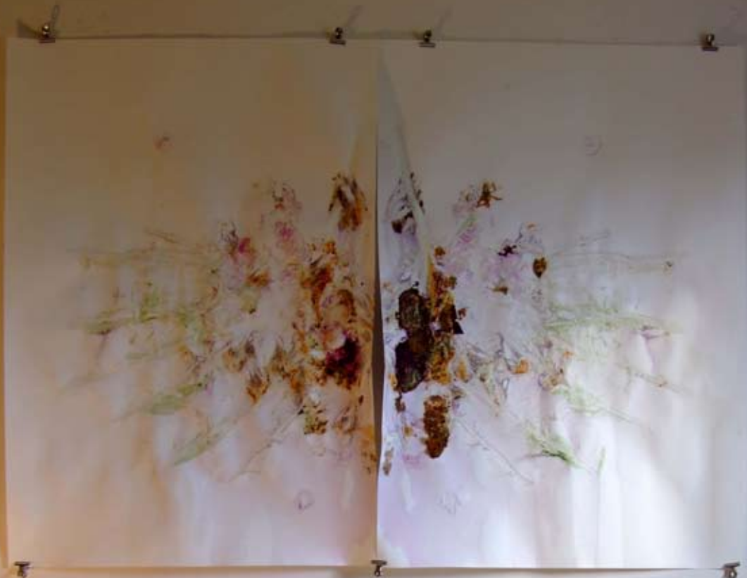
Instalace Světlo III Bendová / Ryneš

Oltářní obraz je vyrobený z otisků živých rostlin a jejich pigmentů. Kompozice předmětů vznikala v průběhu instalace, za využití nalezených předmětů během úklidu.