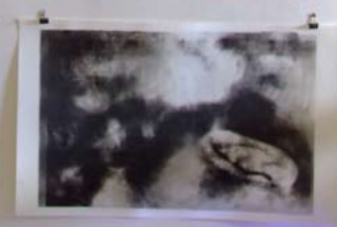
Experimentální grafika Ryneš

fotomonotyp / kresba práškovým grafitem / otisky květin